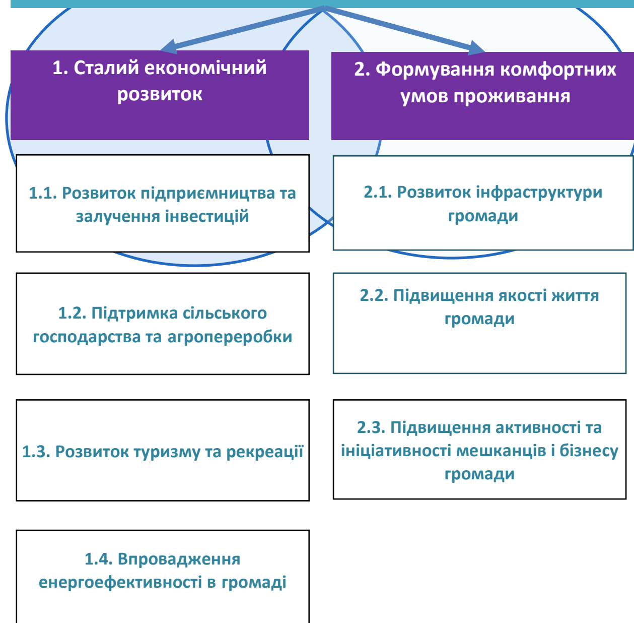
Малюнок 2 Стратегічне бачення, стратегічні та операційні цілі

Михайлівська територіальна громада - культурна, історична, аграрна та рекреаційна громада, розташована на березі річки Тясмин, вздовж автомобільної дороги Н01. Ініціативне та працююче населення і дієва місцева влада забезпечили можливості для самореалізації та розвитку підприємництва, аграрного і переробного бізнесу, туризму та досягнення європейських стандартів життя. Природа наділила громаду корисними копалинами і природно-рекреаційними зонами. Стародавні, могутні ліси та екологічно чисті водойми сформували умови для відпочинку і відтворення населення, збереження культурної та духовної спадщини краю.