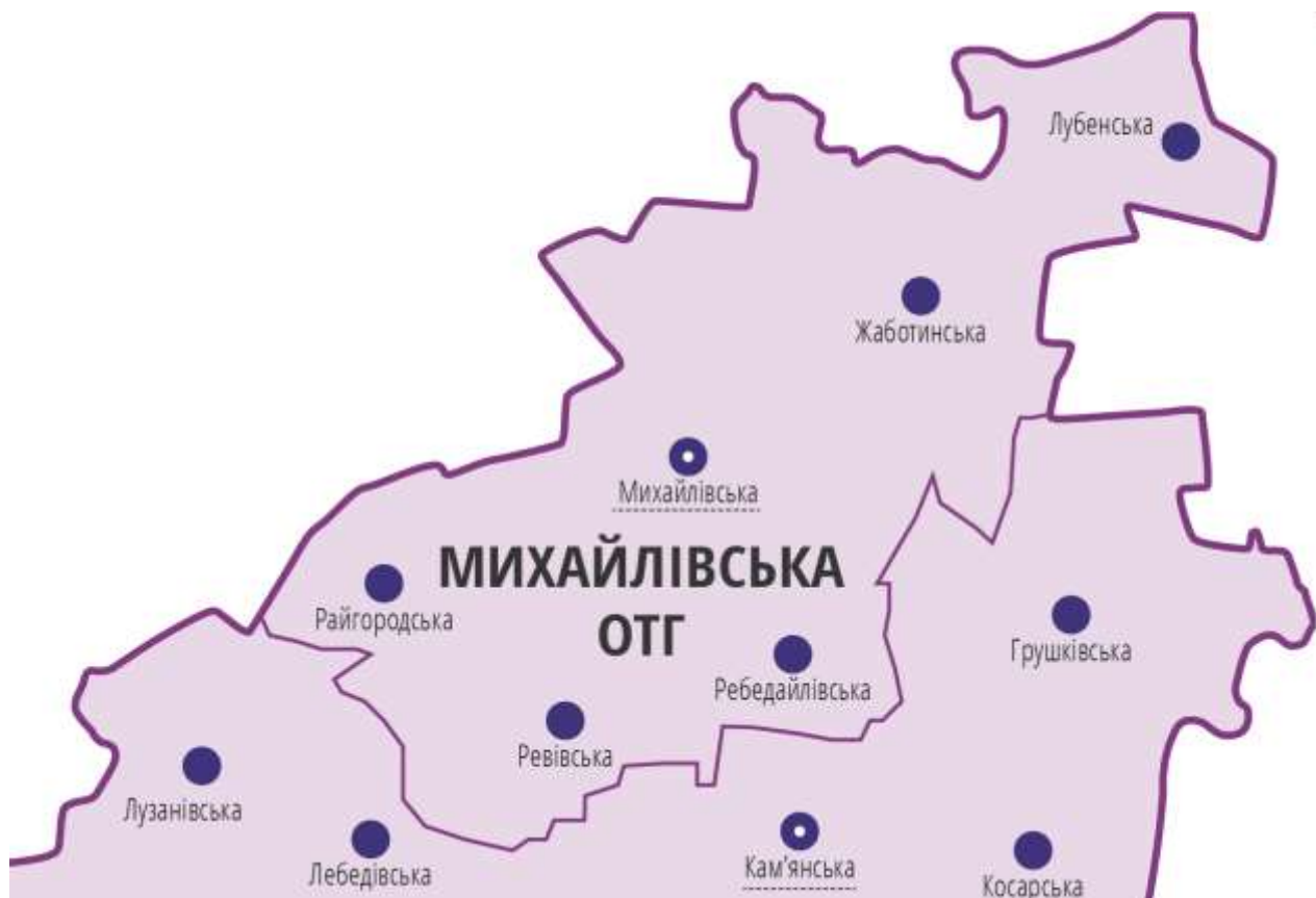
Малюнок 1.Карта Михайлівської сільської територіальної громади